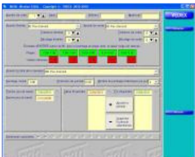
W630 & W300 fiche personnelle

Créer ou modifier un employé est simple et rapide. un employé est affecté à un numéro de carte