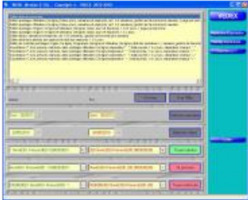
W630 écran imprimer ou exporter

Ceci est la dernière étape. Tout aussi facile que les écrans précédents: il suffit de sélectionner un format d'édition ou d'exportation, de définir les dates début et fin de l'édition, l'ordre de tri de l'édition (par nom, par numéro ou par matricule), l'employé début et l'employé fin, l'impression des heures au format heures et minutes ou heures et centièmes. Cliquez ensuite sur IMPRESSION/EXPORTATION: votre édition est visualisable à l'écran (mode zoom possible), vous pouvez ensuite l'imprimer ou l'annuler.