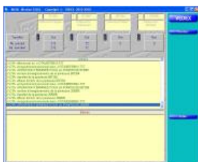
W630 écran de récupération des pointages

W630 recherche automatiquement la clé USB. Le transfert est exécuté sans aucune autre intervention.