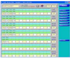
W630 & W300 écran de correction

L'écran de correction présente 3 lignes par jour. La ligne bleue représente les pointages réellement effectués par l'employé, cette ligne n'est pas modifiable par l'utilisateur. La ligne verte représente les pointages transformés par le programme d'après les paramètres d'arrondissement de l'employé, cette ligne n'est pas modifiable par l'utilisateur. La dernière ligne est par défaut identique à la 2e ligne. Sur cette ligne, vous pouvez effectuer toutes vos corrections ou ajouts d'heures. Cette ligne est remplie par le programme tant que vous n'y effectuez pas de modification. Le programme ne la modifie plus dès votre première modification. Gestion de 14 entrées/sorties par jour. La couleur des cases entrée est différente de celle des cases sortie.